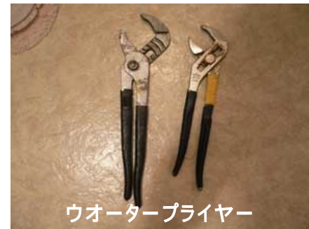
ウォータープライヤー