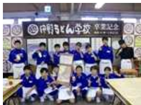
〈中野うどん学校にて〉