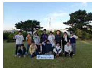
〈舞子ビラ神戸ホテルにて〉