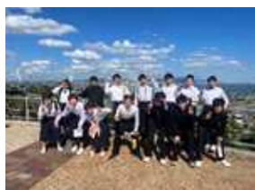
〈淡路ハイウェイオアシスにて〉