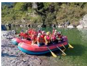
〈ラフティング体験〉