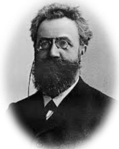
ヘルマン エビングハウス