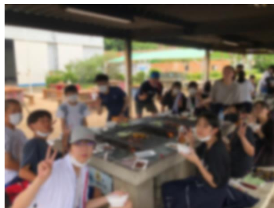
↑ BBQ 1班・5班