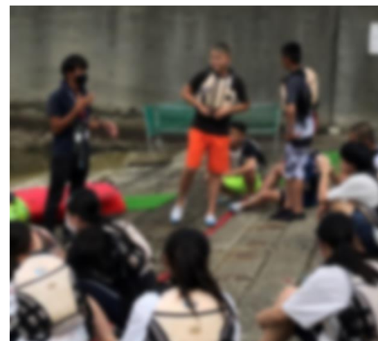
↑カヌーの見本に選ばれた！？