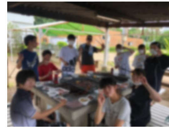
↑ BBQ 3班・6班