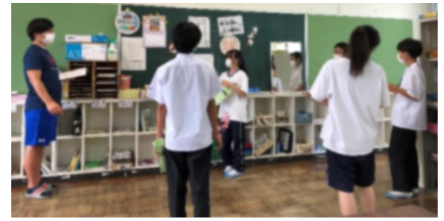
↑放課後、実行委員さんの打ち合わせ