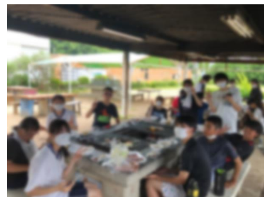
↑ BBQ 2班・4班