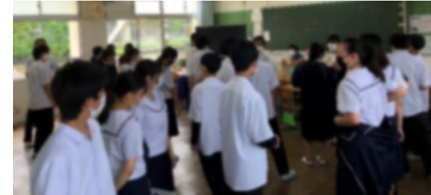
↑実行委員さんによる予行練習風景